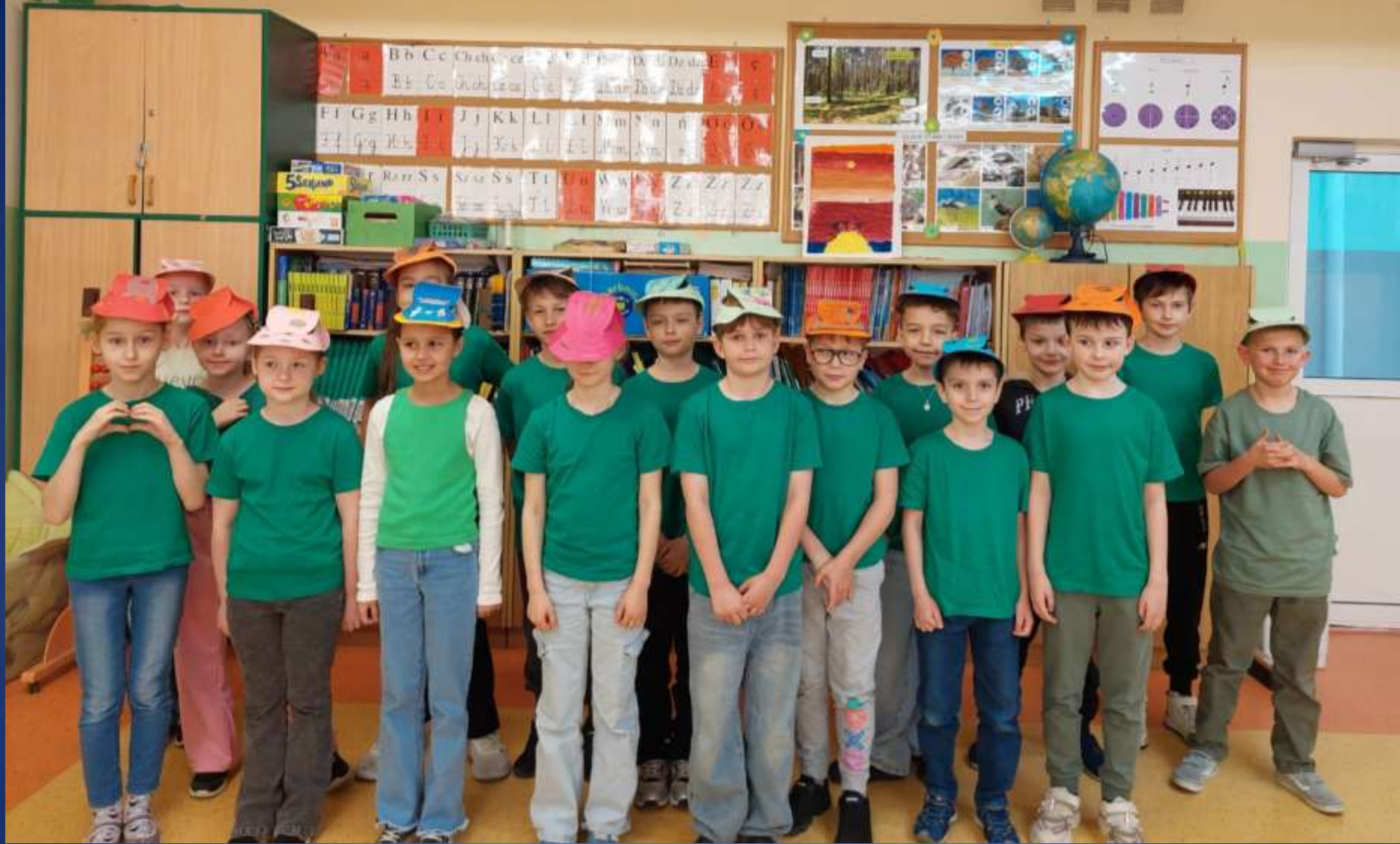
Pamiętkowe zdjęcie w samodzielnie wykonanych i ozdobionych czapkach.