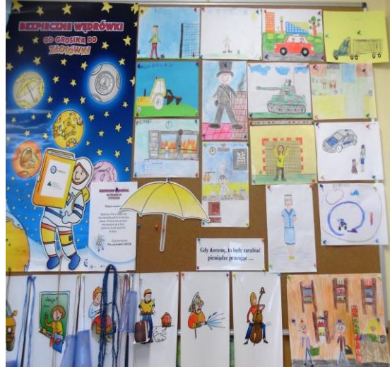
WIEMY, JAK DOROŚLI ZARABIAJĄ