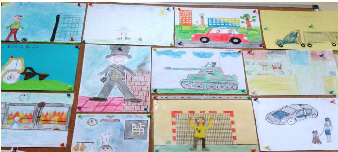
KIM BĘDĘ JAK DOROSNĘ