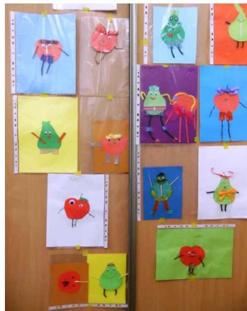
ZNAMY ZASADY ZDROWEGO ODŻYWIANIA